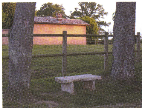
Zone défrichée pendant l'hiver